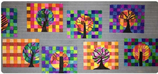
Image 1 Chassillan, M. (2021). Les couleurs | CE2 | Fiche de préparation (séquence) | arts plastiques. Edumoov. https://www.edumoov.com/fiche-de-preparation-sequence/334839/arts-plastiques/ce2/les-couleurs

Puis, coloriez l'intérieur du cercle avec des couleurs chaudes et l'extérieur avec des couleurs froides (ou l'inverse). Alternez les couleurs selon vos goûts. Attention, deux carrés d'une même couleur ne doivent pas se toucher.