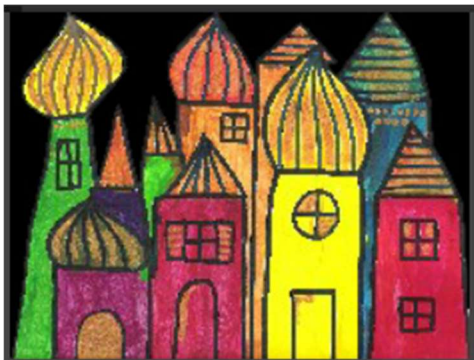
Image 2 Chassillan, M. (2021). Les couleurs | CE2 | Fiche de préparation (séquence) | arts plastiques. Edumoov. https://www.edumoov.com/fiche-de-preparation-sequence/334839/arts-plastiques/ce2/les-couleurs

Le village ainsi créé peut être collé sur une feuille noire pour mettre les couleurs en évidence.